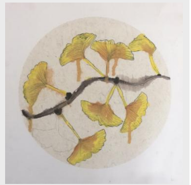
《银杏》 零部件乘齿分厂孙丹之女 毛佩蓉(7岁)