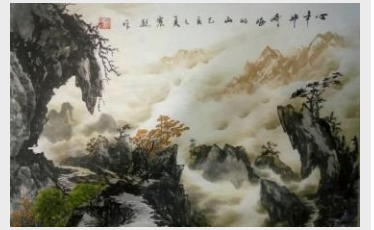
《远山》 乘变热处理车间 曹震敏