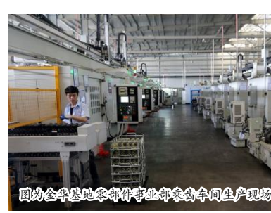
图为金华基地零部件事业部乘齿车间生产现场

做强汽车零部件产业是中国汽车工业发展的根基,在汽车零部件行业深耕二十余载,万里扬人始终不忘做强民族自主汽车零部件产业的初心,坚持做正确的事情就一定会变强大,以时不我待、只争朝夕、刻不容缓的精神状态投入到“大制造”建设中,敢于向危机亮剑,始终秉持工匠精神,抓好降本提质增效,打造性价比、质量、服务最优的产品。曹立为告诉记者,万里扬零部件事业部目前主要以满足内需为主,未来会实现对外销售。通过做强“大制造”,进一步扩大万里扬在整个汽车零部件行业的影响力和市场占有率,助力万里扬在通往世界级的道路上步履稳健地向前迈进,真正打造一个中国汽车零部件的新地标。