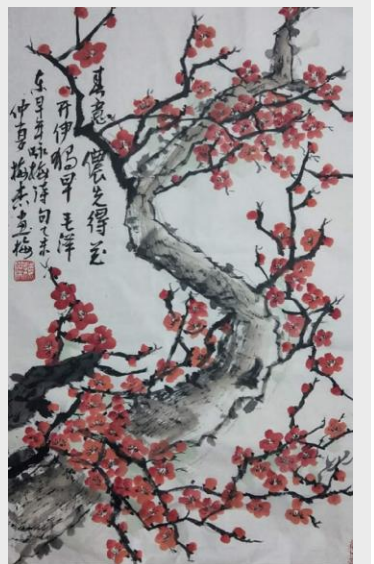
《梅》 零部件商齿分厂 梅杰