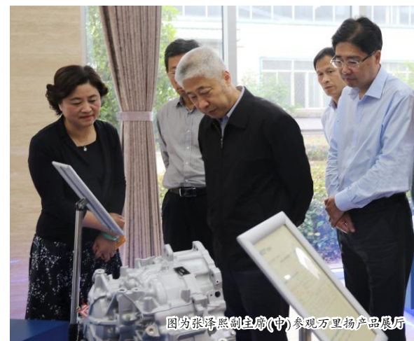
图为张泽熙副主席(中)参观万里扬产品展示厅