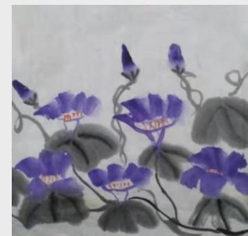
《牵牛花》 高变研究院毛建平之女 毛佩蓉(7岁)