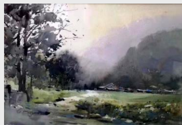
《宁静》 内饰研究院 高芝宝