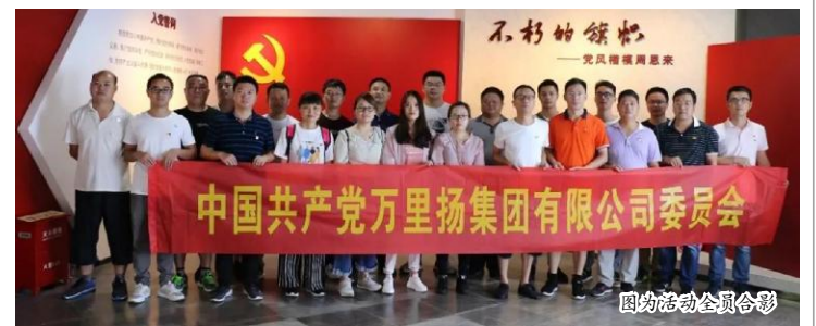
图为活动全员合影