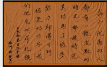
《扎根》 内饰涿州工厂 柳继男