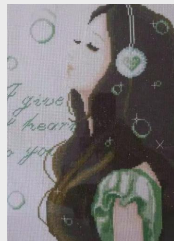
《倾听》 内饰芜湖工厂 高妍