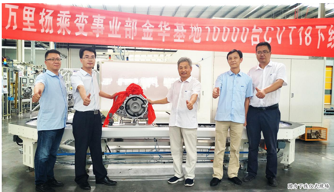
图为下线仪式现场

越来越严苛的排放标准出台,小排量高性能发动机将成为未来趋势,万里扬 CVT18 变速器的顺利批量投产恰逢其时。作为万里扬细分市场的战略产品,CVT18 变速器是在 CVT25 变速器研发平台上的创新和延伸,具有速比范围大、体积小、重量轻、油耗低等特点,各项性能指标可比肩国际一流同类变速器。目前,CVT18 变速器已成功匹配吉利、奇瑞、比亚迪等中国主流品牌汽车,可以预见的是,CVT18 变速器的批量投放市场,将为小排量乘用车市场注入新的活力,中国小排量乘用车变速器市场格局将被改写。