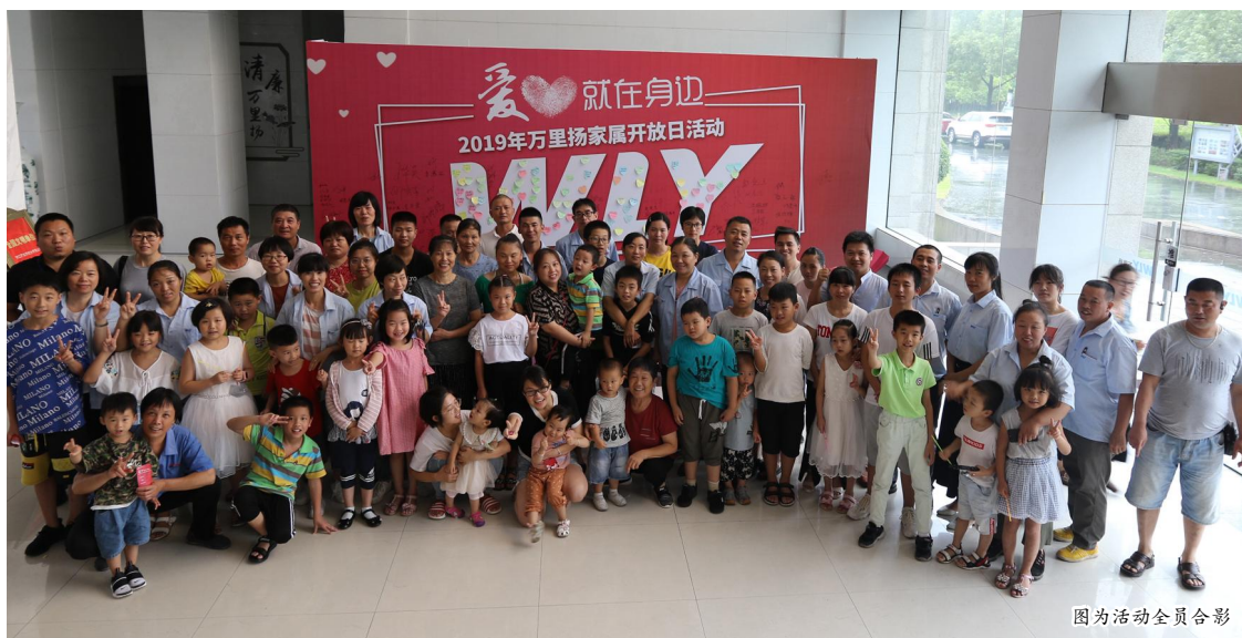
图为活动全员合影

“我最想感谢老婆,平时工作忙,家里的事情都是老婆一个人在操持,这些年她带两个孩子太辛苦了”……8月10日,虽受超强台风“利奇马”的影响,金华风雨交加,但这丝毫不影响万里扬人参与活动的热情。在万里扬金华基地商学院内,近百名员工及家属互诉衷肠,员工们纷纷上台感恩家人的辛苦付出,说到动情处数度哽咽,更让现场听者潸然泪下。这是“爱就在身边”2019年万里扬家属开放日的现场,现场涌动着脉脉温情,爱和温暖在这里传递,为企业、员工及家属之间架起了一座沟通的桥梁。(详见 2 版)